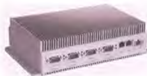
RTU-327L и RTU-327LV